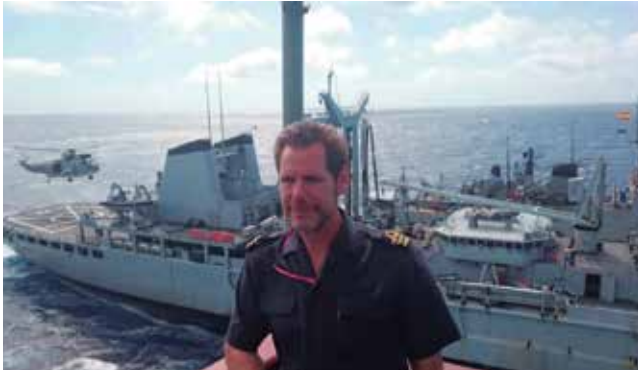
Embarcado en la Operación Atalanta contra la piratería en el Índico

Sevilla es marinera, aventurera en el mar con grandes hazañas y gestas a lo largo de los siglos. El río se une con el atlántico, pero el Guadalquivir para un capitán de navío, con todos estos antecedentes ¿es como un mar? En 1503, la Reina Isabel la Católica estableció la Real Casa de Contratación en Sevilla, convirtiéndola en el centro mundial del comercio con el nuevo mundo, origen de las grandes expediciones marítimas y cuna de mareantes en la Escuela de San Telmo.