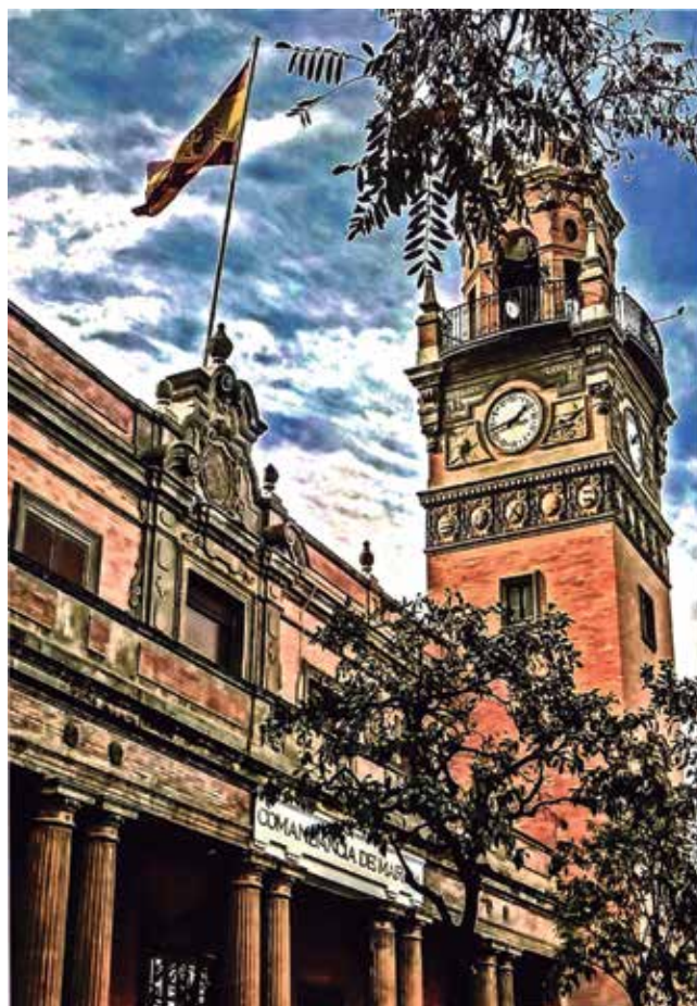
Comandancia Naval Sevilla

Desde hace cuatro años el 3 de mayo es el día histórico de la Armada, ya que la hazaña de Bonifaz es considerada como el inicio de la Marina de Castilla y por herencia, de la propia Armada.