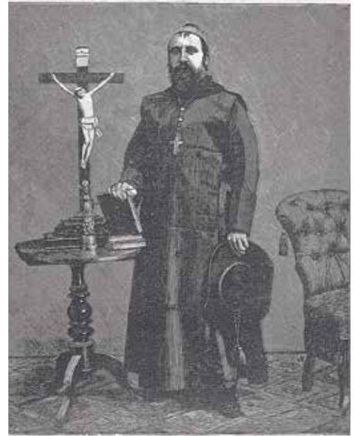
EL REVERENDO PADRE FRAY ROSENDO SALVADO Obispo de Puerto-Victoria

Ha sido objeto de múltiples homenajes, destacando la estatua en Tui, Galicia, financiada por suscripción popular en 1949.