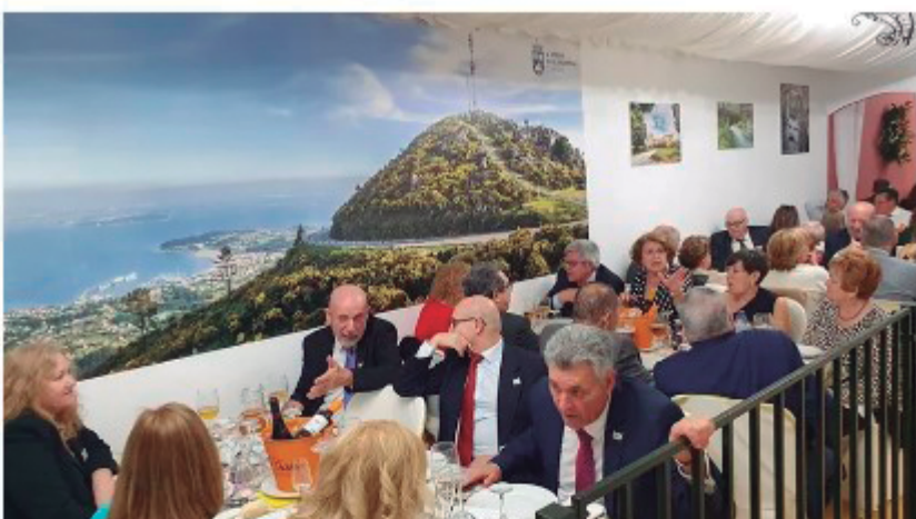
Una gran imaxen de la ría de Arousa tomada desde A Curota adornó la caseta de la asociación Lar Gallego de Sevilla cedida

De este modo, el Centro Gallego de Santander ofreció una sesión monográfica sobre la figura de Fernández del Riego, en la que también se proyectaron diversos vídeos. Lo mismo tuvo lugar en el Centro Gallego de Salamanca, en la Asociación Galega Comendador Macome, la Casa de Galicia en