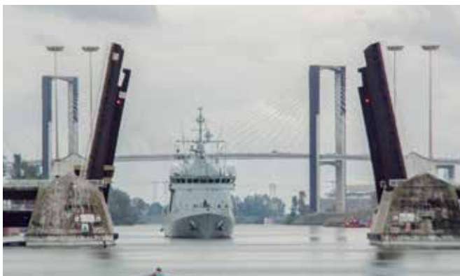
Buque de Acción Marítima de la Flota entrando en Sevilla

Gallegos con raíces asturianas, en mi caso nacido en Madrid, aunque como decimos los marinos, somos del lugar donde vivimos en cada momento... por otra parte, casarme con una gaditana y mi condición de hidrógrafo ha marcado mi carrera en la Bahía de Cádiz.