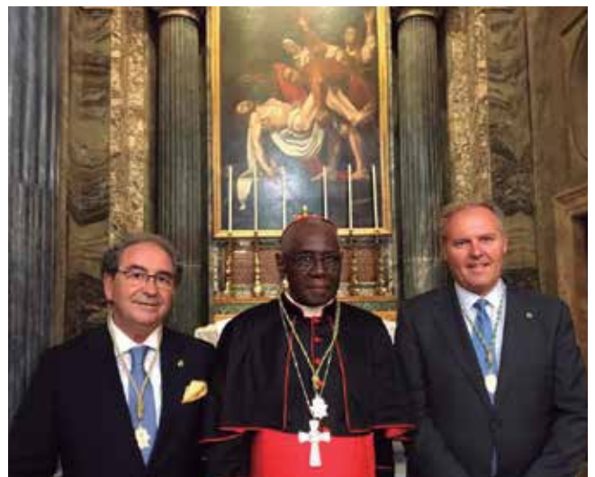
Con el Cardenal Robert Sarah del Orbe Carólico

¿Unas palabras para el Lar Gallego? El Lar Gallego de Sevilla, lo he visitado en ocasiones, y debo decir primero que me encanta la comunidad gallega de Sevilla. Siempre he tenido una devoción especial y una inclinación con el pueblo gallego, tal vez porque aprendí a hablar vuestra lengua, pero mi corazón es un poco gallego, porque Galicia y Cantabria con sus climatologías se parecen mucho entonces la nostalgia, que a mí me gusta en los momentos nostálgicos... La gente cuando están nostálgicos se quejan, y yo digo ¡no!, la nostalgia es una vivencia como lo es la alegría, la esperanza y el resto de estados del hombre. Me encantan las dos situaciones, la alegre y la melancólica, de las dos aprendo mucho y esas también se aprenden en Galicia. El Lar Gallego es una comunidad que representa perfectamente a Galicia, es un trocito de Galicia insertado en el alma de Sevilla, y mis vivencias en el Lar con los gallegos de aquí son fuertes, íntimas, personales y muy gloriosas en el trato.