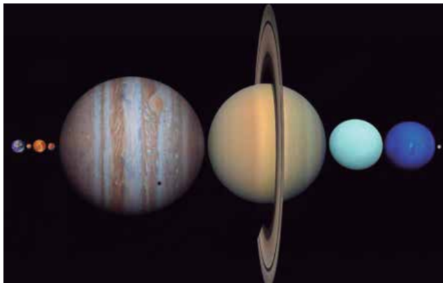
Representación gráfica a escala del diámetro de los planetas. De izquierda a derecha: La Tierra, Mercurio, Venus, Marte, Júpiter, Saturno, Urano, Neptuno y la Luna.