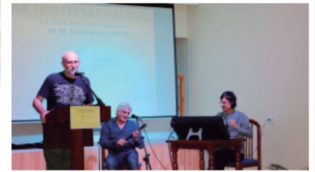
© Celebración del Día das Letras Galegas en Sevilla.

De este modo, el Centro Gallego de Santander ofreció una sesión monográfica sobre la figura de Fernández del Riego, en la que también se proyectaron diversos vídeos. Lo mismo tuvo lugar en el Centro Gallego de Salamanca, en la Asociación Galega Comendador Macome, la Casa de Galicia en