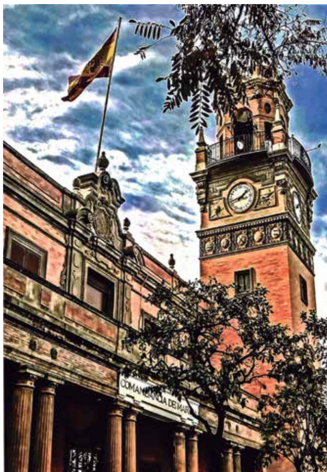
Comandancia Naval Sevilla

Desde hace cuatro años el 3 de mayo es el día histórico de la Armada, ya que la hazaña de Bonifaz es considerada como el inicio de la Marina de Castilla y por herencia, de la propia Armada.